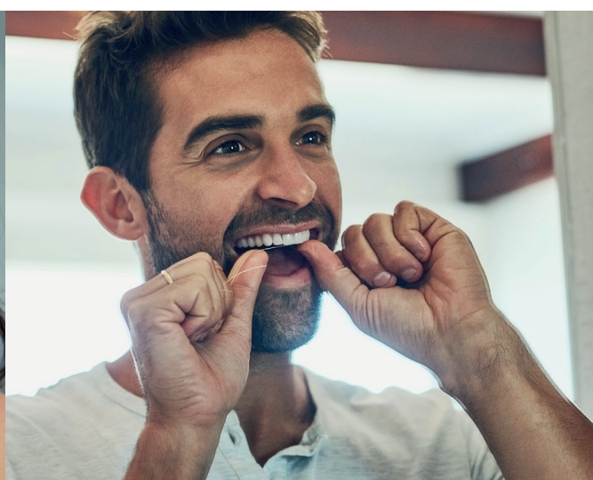
HIGIENE INTERPROXIMAL 1 vez al día