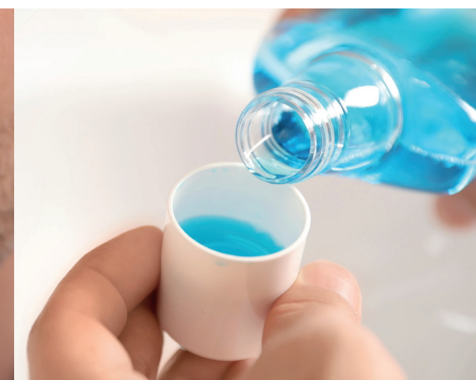
ENJUAGUE CON COLUTORIO 2 veces al día - 30 seg