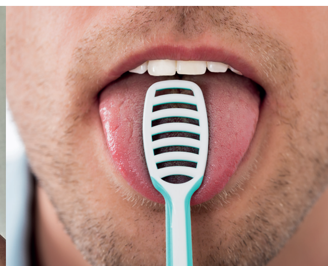
LIMPIEZA DE LENGUA 1 vez al día