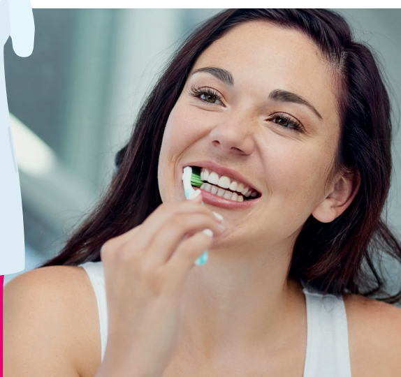
CEPILLADO DE DIENTES 3 veces al día - 2 min